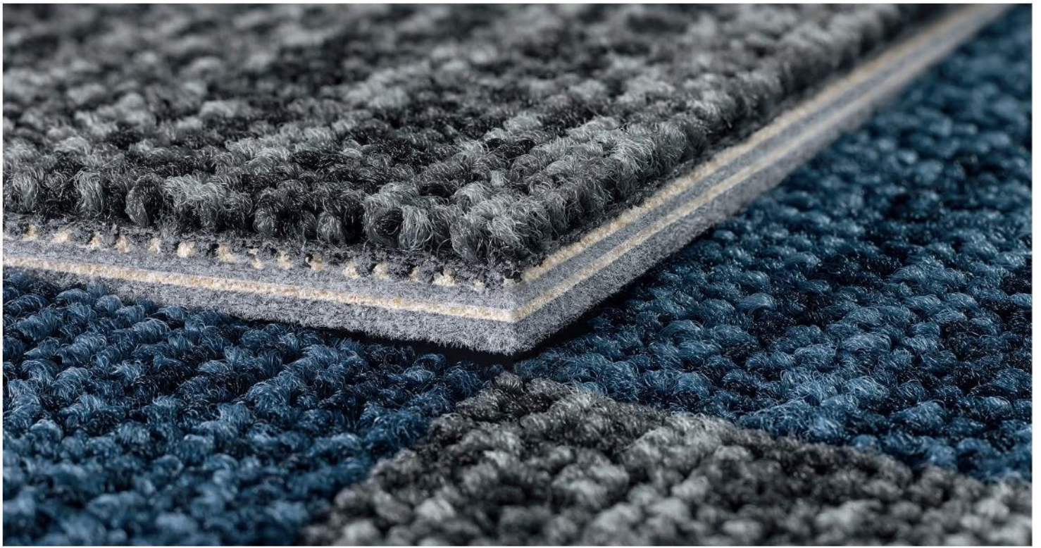
Akustinen tekstiililaatta SL Sonic, Superior 1052 SL Sonic, 3Q10 ja 9F87

Vakaa, bitumi- ja PVC-vapaa, ekologinen ja helposti asennettava lattiapäällyste, joka parantaa askelääni- ja akustiikka-arvoja merkittävästi